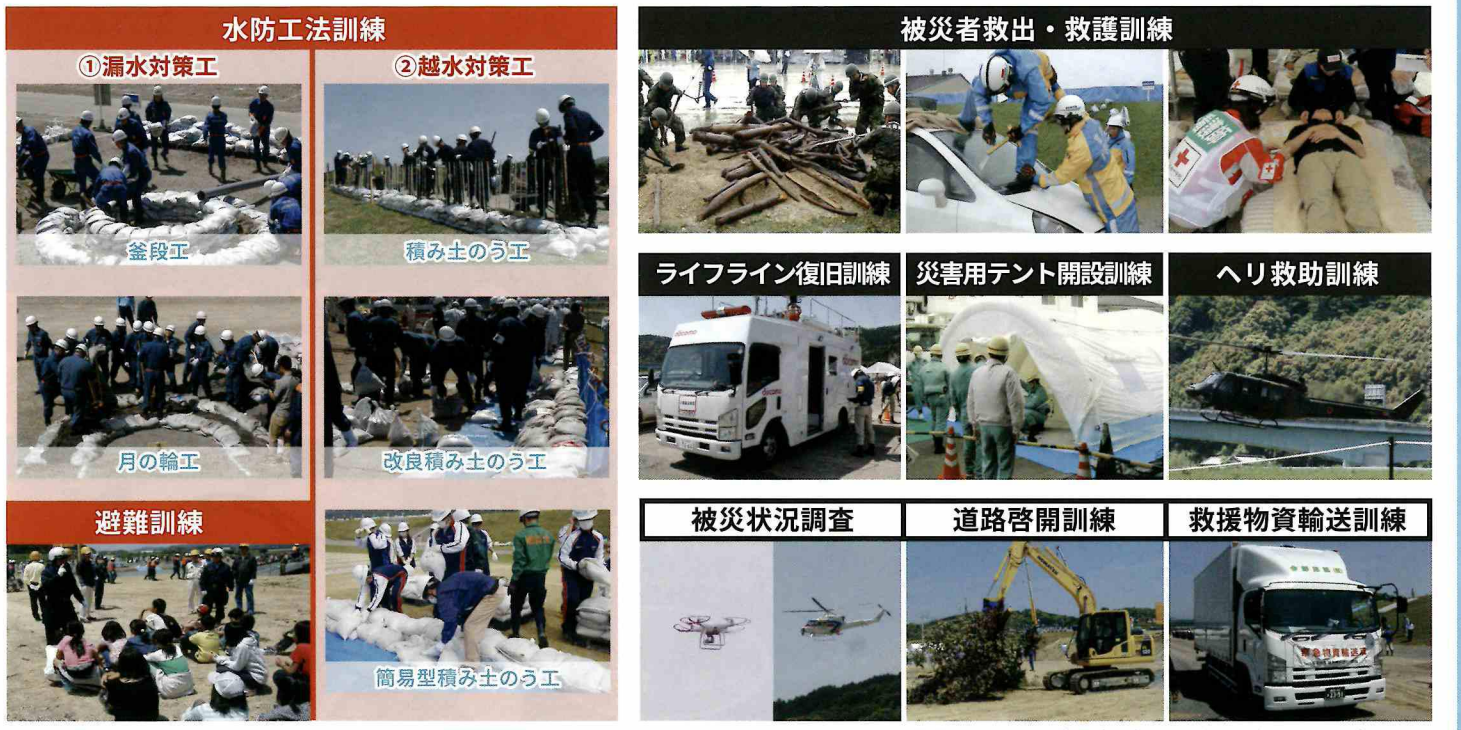
※演習プログラムは予告なく変更することがあります。

第1部は、水防警報等発表時における関係機関との情報伝達訓練及びホットライン訓練並びに、水防工法を行います。第2部では、氾濫発生を想定した災害調査訓練及び被災者救出訓練などの災害対応訓練を行います。