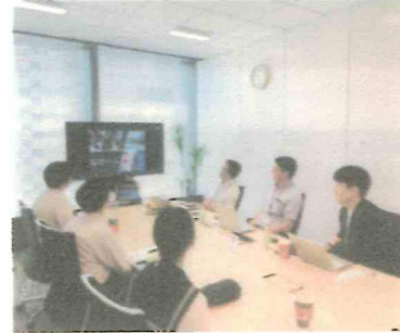
長瀬産業様のオフィスにて

ツアー2日目の午前中は、長瀬産業(株)様を訪問しました。2日目になると名刺交換や自己紹介にもだいぶ慣れてきたようで3人の成長を感じます。長瀬産業様からは会社紹介、梶原町との取り組みを主に話して頂きました。長瀬産業様は、2022年8月から脱炭素先行地域としても認定されている梶原町と協定を結び、J-クレジット(森林クレジット)創出の実証に取り組んでいます。3人ともJ-クレジット