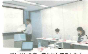
プレゼンの姿、堂々としてました!

梶原町の魅力や改善点などについて発表してもらいました。3人とも緊張しながらも梶原町の未来について真剣に考えて、堂々と企業様にプレゼンする姿が印象的でした。