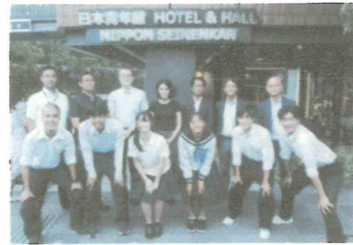
『未来守』の皆さんと一緒に

その日の夕方からは、明星高校の生徒で、高校生ボランティア団体『未来守』に所属する都内の高校生と交流会のため、一般財団法人日本青年館にお邪魔し、それぞれの活動内容の発表や夕食を取りながら高校生同士で意見交換を行いました。全く違う土地で育った生徒同士が意見交換をする場はなかなか珍しく、お互いに刺激を受けたようで、今後も梶原町と東京を行き来する交流会を開催したいと話していました。