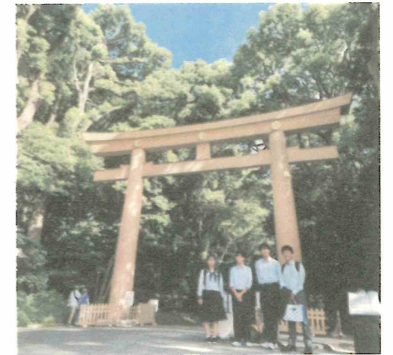
3日間のツアーお疲れ様でした!最後は明治神宮にて

高校卒業後、一度は町外に出ることがあるかもしれませんが、梶原の地で育ち、学んだことに誇りを持ち、また帰ってきて梶原の豊かな資源を活かしたチャレンジをしたいという、学生が今後出て来てくれたら嬉しい限りです。このツアーが引き続き開催されることを切に願っています!!