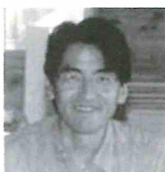
若かりし頃の青山氏

林野庁長官 青山 豊久 -Toyohisa Aoyama- 梶原町における、全国初の棚田オーナー制度の創設(1992年・平成4)に力を発揮していただくなど、梶原とゆかりの深い方。令和5年7月に林野庁長官に就任。