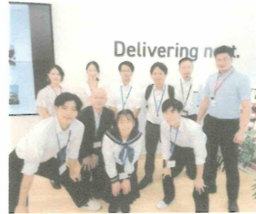
長瀬産業の皆さんと一緒に

適切な森林管理によるCO2などの温室効果ガスの吸収量を「クレジット」として国が認証する制度で、間伐や雑草をはじめとする森林資源の適切な管理、活用を目指す自治体や、カーボンニュートラルに取り組む企業で積極的に利用されています。