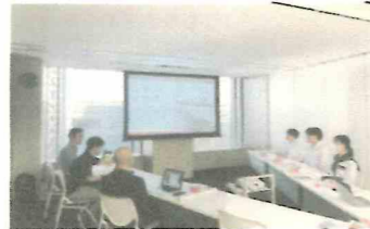
前原氏、木村氏による取り組み紹介