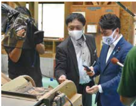
できあがったばかりの木質ペレットを手に