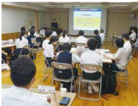
第2回学校運営協議会

梶原学園は、保護者・地域と共にある学校です。コロナ禍ではありますが、梶原学園PTAが、今できる活動を続けていますし、小学校棟一階には、学校応援団もあり、さまざまな支援を地域の方々から受けています。そのおかげで、児童生徒たちがたくさんさんの経験をし、成長しています。学校教育目標にある通り、児童生徒が「未来に向かってたくましく生き抜く梶原人」となるよう、今後も保護者、地域の方々と共により良い梶原学園を作っていきます。 今回は、保護者や地域の方々の協力の一部を紹介します。