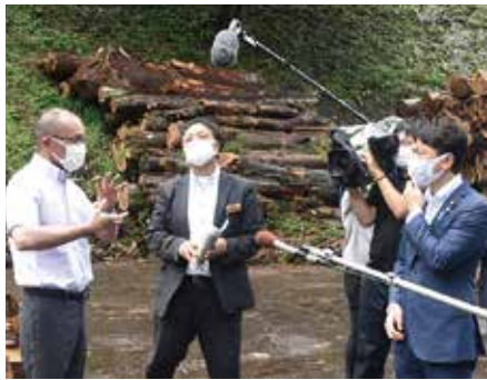
中越工場長が木質ペレットについて説明