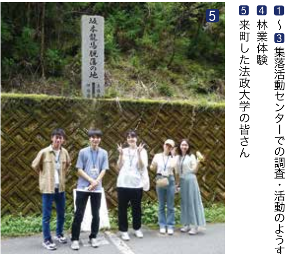
1 集落活動センターでの調査・活動の様子 2 林業体験 3 来町した法政大学の皆さん

最終日の活動報告では、高齢化や人手不足、後継者問題など課題はあるものの、地元の人々が課題を自分事として考え、住民同士が思いやり支え合い、結束力を感じ、自分たちで町をつくっているという意識のあることが、「住民が愛着を持てるまちづくり」につながっていると感じが聞かれました。また、地域と役場の人、地元と移住の人の話ができて場所があればいいのでは、といった提案がありました。