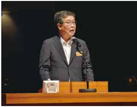
吉田町長による取り組み紹介