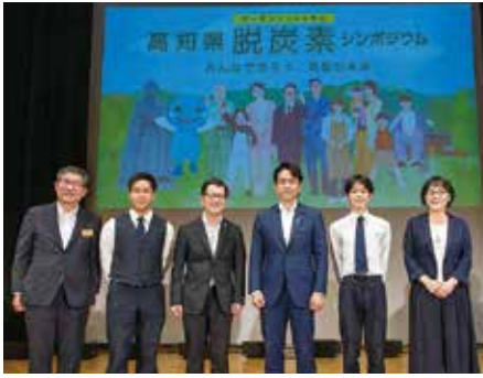
シンポジウム会場(高知市)にて