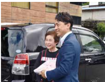
昼食は集落活動センターはつせのお弁当