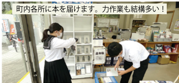
町内各所に本を届けます。力作業も結構多い！

卒業後の進路について現実味が増してくる高校2年生。今年は栲原高校から5名の皆さんがインターンシップに参加してくれました。本と向き合う地道な館内作業から、町内外の利用者と対話する接客業務まで、外からでは分からない図書館の様々な仕事を体験してもらいました。折良く開催されたバレエ公演では、イベントスタッフとして来館者の誘導をする、という貴重な経験も。これらの成果は、高校の総合的な探求の授業で発表されたそうです。