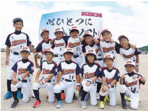
梶原ファイターズJSSC

チームの悲願でもある全国大会一勝に向けて選手たちのこれからの活躍に御声援のほどお願い致します。