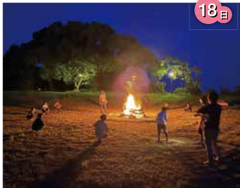
キャンプファイヤー