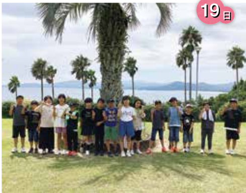
海を背景に記念撮影