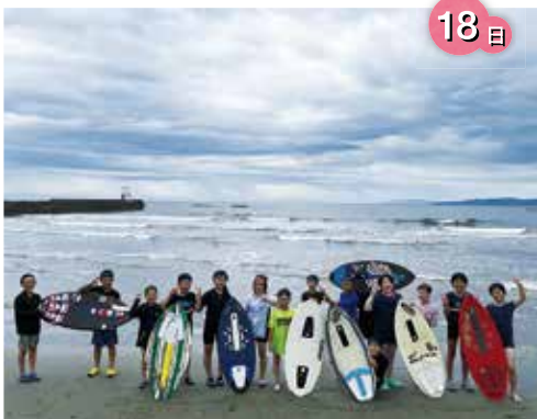
スキムボード最高！