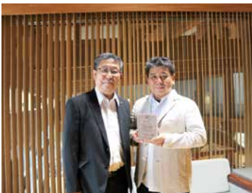
ゆすはら未来大使任命式