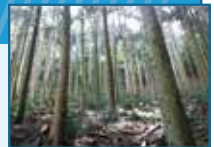
間伐を行い適切な森林環境へと整備