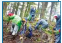
令和4年4月29日に実施した梶原町の森林づくりの様子(植樹)