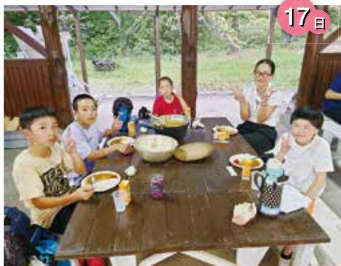
みんなで作ったカレーはおいしいね