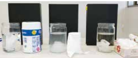
トイレットペーパー以外は水に溶けていません