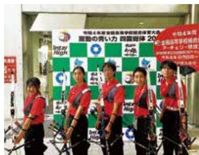
本校のアーチェリー競技出場選手

全国高校総体アーチェリー競技が、香川県丸亀市で行われ、本校の男女アーチェリー部が出場しました。全国の壁は厚く入賞はかたやいませんでしたが、大舞台での貴重な経験ができました。1、2年生が来年につなげてくれることを期待しています。