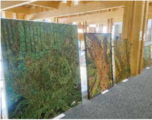
寄贈いただいた絵画の展示

このたび寄贈いただいた油絵は、「アカガシ」をテーマとした作品となっており、絵画の中に