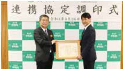
企業版ふるさと納税寄付に対して感謝状贈呈