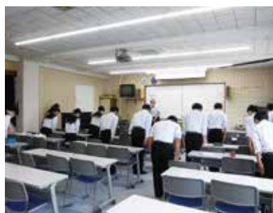
面接スキルアップセミナー