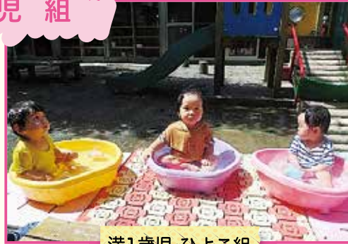
満1歳児・ひよこ組