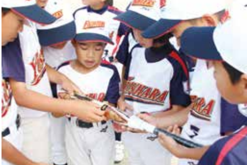
新しいバットで西日本大会へ挑もうとする梶原ファイターズ