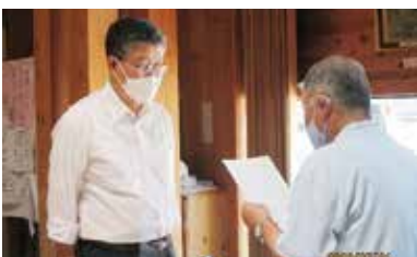
内閣総理大臣のメッセージ伝達式

また、パレード後に梶原学園を訪問し、次代を担う小中学生のみなさんに、この運動に対する理解を深めてもらうことを目的に「社会を明るくする運動」作文コンテストへの参加をお願いしました。