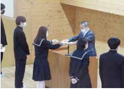
非行防止教室・生徒会認証式