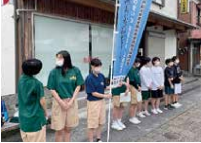
四国高校総体一斉PR