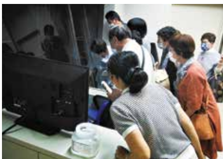
処理場の機械を見学中

は、遊んで火が完全に消えたものを捨てるようにしましょう。もし未使用の花火が混ざっていると、可燃ごみをRDF（固形燃料）にリサイクルする際に火災を引き起こす原因になってしまいます。