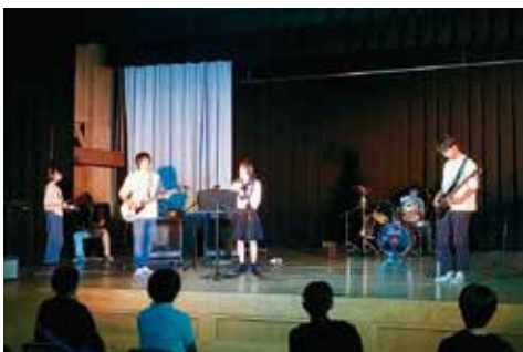
高校生文化交流で演奏する地域の高校生バンド

部員がいたため、急遽、予定していた演目を「ピロシキ」と「コンビニ強盗」に変更しての公演となりました。どちらもショートコント仕立てで会場は和やかな雰囲気生まれ、地域の皆さん約30名が高校生の文化芸術を楽しみました。 土佐女子中高演劇部は、高知県代表として四国大会に連続8回出場し、2020こうち総文や春季全国高校演劇研究大会に参加、上演するなど高知県の高校演劇を牽引する高校の一つで