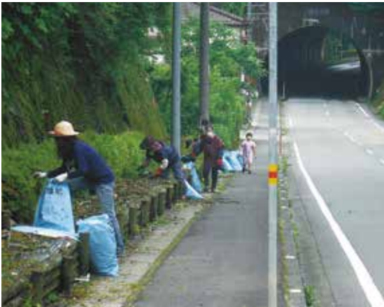
大人も子どもも協力して作業

6月21日（火）、梶原町廃棄物減量等推進員連絡協議会は、梶原町の可燃ごみやし尿等を処理している高幡東部清掃組合（中土佐町）に視察研修に行きました。