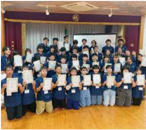
最後にみんなで記念撮影

たけれど、自分を知ることができたことが一番良かった」などの回答がありました。 また、「あなたにとって English キャンプとは？」という問いには、「学びの宝庫」、「自分探しの場所」、「自己肯定感の向上」という回答がありました。 今回の経験が梶原町の子どもたちにとって英語を学ぶ意欲を高めたり、自分の生き方を考えたりするきっかけになればと思います。 最後に、今回の English キャンプ開催にあたっては、遊友館をはじめ、越知面区のみなさまには大変お世話になりました。ありがとうございました。