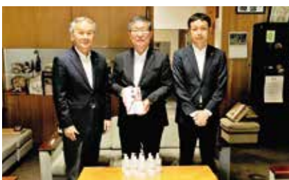
手指消毒液贈呈式

いただきましたマスクや手指消毒液は、感染防止対策のため有効に活用させていただきます。 総務課 総務危機管理係