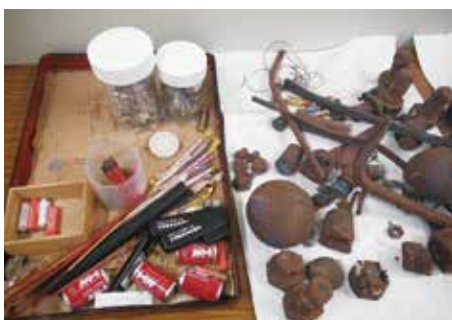
実際に可燃ごみに混ざっていた物