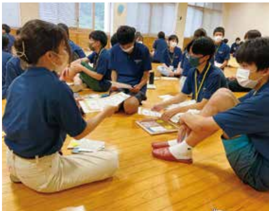
真剣に考えています

かけになり、少しずつ緊張もほぐれていきました。例年なら英語が飛び交うランチタイムのはずでしたが、感染対策に気をつけながらの今年のキャンプでは、食事中はおしゃべりなしで、全て黙食でした。気軽に話せる人が少しできてきたところで、午後から1回目のワークショップです。答えのない問いに対して参加者同士が協働し、創造性を発揮しながら