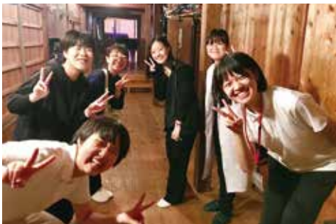
土佐女子中高演劇部の皆さん(楽屋にて)

土佐女子中高演劇部 「ゆすはら座」で文化交流・芸術発信 7月26日(火)～28日(木)の3日間、土佐女子中学高等学校の演劇部が梶原町で夏の合宿を行いました。梶原町での合宿は今年で4回目となり、例年は「梶原ふじの家」に訪問して公演をしていましたが今回は地域の皆さんに合宿の成果を観てもらいたいと、合宿最終日の28日(木)の午後に「ゆすはら座」で公演を行いました。 この公演に参加したのは演劇部の部員11名と顧問2名です。コロナ禍の影響で参加できない