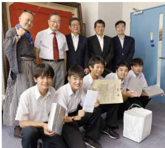
受章チームへの表彰