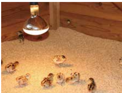
雛は寒いのが苦手です暖かくしています

この支援事業が採択されるには厳しい審査会があり、集落活動センターが事業実施主体となり採択されたのは高知県で初めてのことです。大きな責任を感じながら事業の成功のために地域一丸となって取り組んでいきます。町民の皆さま、キジ肉購入や販路拡大にご支援・応援よろしくお願ひします。