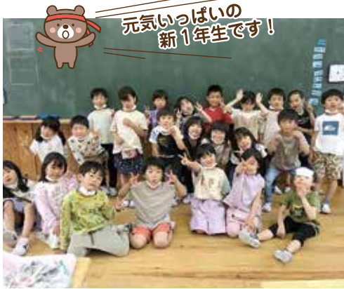
元気いっぱいの新1年生です！

子どもたちは自身は勿論、訪問先の各施設等でも感染予防対策は徹底されており、2学年共に元気に帰校することができました。子どもたちにくさんの思い出と学びを得る機会を与えて頂いた保護者の皆さまに、心より感謝です。