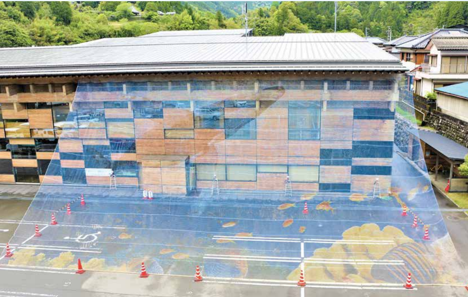
庁舎前の「空飛ぶクジラ」