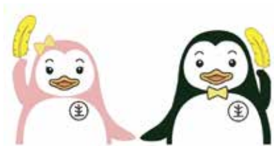
サラちゃん ホゴちゃん (マスコットキャラクター)