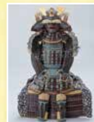
浅葱糸素懸威二枚胴具足 (7代藩主豊常所用)