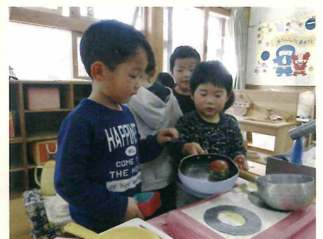
お兄ちゃんと一緒にままごと

た!」「一緒に、積み木を高くして遊んだ」と、幼児組と一緒に遊べたことを楽しんで話す姿がありました。お兄ちゃんお姉ちゃんと遊ぶうさぎ組はとってもニコニコしていましたよ。優しく一緒に遊んでくれて、うれしかったでしょうね。 4月からは、それぞれが進級し、新しいぱんだ組・きりん組・ぞう組となります。新しい生活が楽しいものになるよう、幼児組と乳児組が触れ合って遊べる子ども園の特徴を活かしながら、普段の日の交流も続けていきたいと思えます。