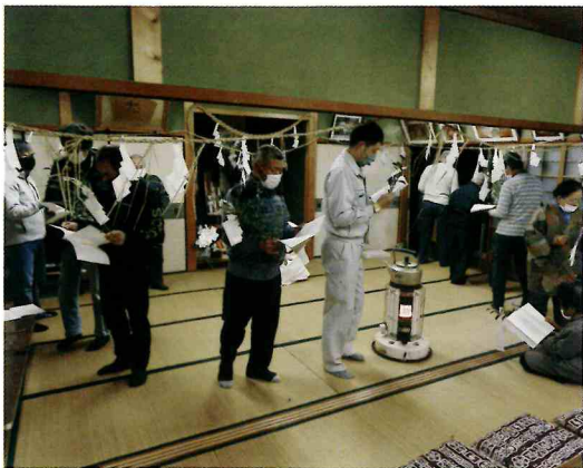
お伊勢踊りの様子