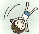
表現・マット運動 「♪ヒカレ」

心身共にたくましく成長した姿を見せてくれました。梶原学園のお兄さんお姉さんになりましたよ。