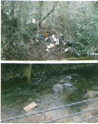
山林や河川へのごみの不法投棄の写真

町内における河川、山林、空き地などへのゴミの不法投棄が散見されます。不法投棄は重大な犯罪です。廃棄物は決められたルールに従って適正に処理しなければなりません。『廃棄物の処理及び清掃に関する法律』では「何人も、みだりに廃棄物を捨ててはならない」と定め不法投棄を禁止するとともに、重い罰則（懲役5年以下、罰金1、000万円以下、法人の場合は3億円以下）が定められています。一部のモラルのない人が廃棄物の適正な処理を行わず不法投棄を行うことにより、景観を損ねるだけでなく、更なる不法投棄を助長することになります。一人ひとりが自覚を持ち、自分のゴミは自分で適正に処理し、町内を常に美しく保つようによみましょう。また、土地や建物の所有者や管理者は、不法投棄を誘発しないよう