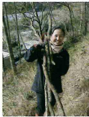
森の魅力を伝えたい！何事もまずはチャレンジ！！

協力隊任期の3年が過ぎても、自然と共生しながら、家族と笑顔で楽しく生活していきたいと思っています。