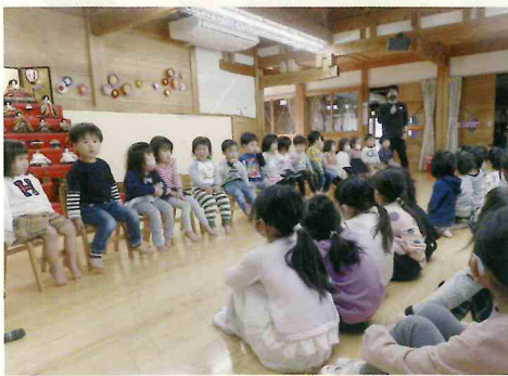
4月から幼児組さん

り、一緒に踊りを踊ったりしました。大きな声で返事をする様子に「かわいい」という声も聞かれました。そのあとはお兄ちゃんお姉ちゃんに誘ってもらい、積み木やブロック、ままごとや一緒に体を動かすなど、それぞれのクラスが部屋で楽しんでる玩具や用具で遊びました。うさぎ組の子の手を優しく取って、「一緒にこっちで遊ぼう!」と声をかける子、ままごとコーナーではうさぎ組に食べてもらおうとご飯を作ったお兄ちゃんお姉ちゃんなど、それぞれの様子が見られました。終了後、「○○ちゃんがおつ