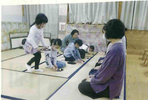
お家の人へお運び

ぱんだ組からお茶席に参加し、ぞう組になって初めて扇子を持って挨拶するところからお運びの作法まで、つひとつ丁寧に教えてもらいました。今年度はコロナ対策として時間をずらして2班に分かれ、座の間隔も開けて行いました。嬉しかったり緊張したりする姿もありましたが、今まで取り組んできたことを思い出しながらお運びをすることができ