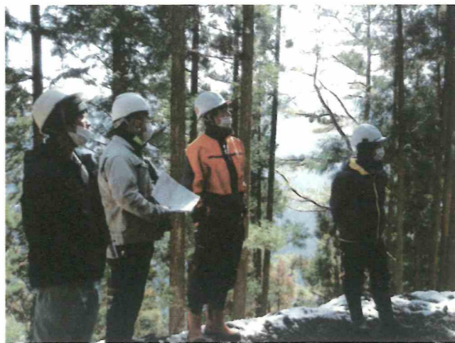
間伐の作業システムについて意見交換