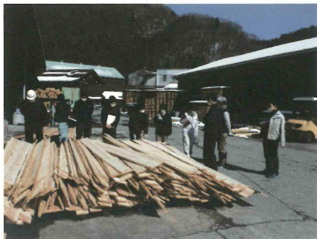
製材の工程について丁寧に説明する塾生