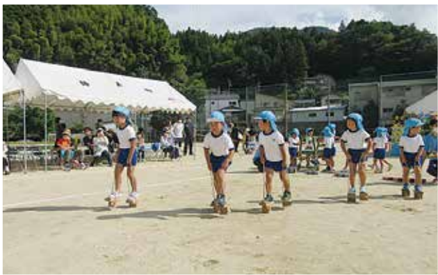
【年中児】一本下駄に挑戦

もいきましたが、お部屋で親しんできた踊りの曲が流れると、自分なりにリズムにのって踊る姿を見せたり、お家の人のところまでかけっこをしたり、最後には笑顔でゴールすることができました。幼児組では、各クラスとも春から取り組んできた竹馬や一本下駄、ぼっくりなどを取り入れた競技や踊りを披露し、楽しく参加したり、挑戦している姿をお家の人にも見てもらう