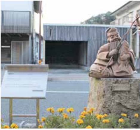
津野山神楽モニュメントと説明看板