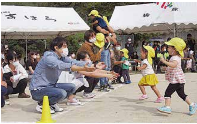
【うさぎ組】かけっこ「ここまでおいで」

もいきましたが、お部屋で親しんできた踊りの曲が流れると、自分なりにリズムにのって踊る姿を見せたり、お家の人のところまでかけっこをしたり、最後には笑顔でゴールすることができました。幼児組では、各クラスとも春から取り組んできた竹馬や一本下駄、ぼっくりなどを取り入れた競技や踊りを披露し、楽しく参加したり、挑戦している姿をお家の人にも見てもらう