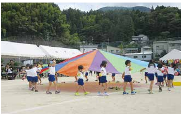
【年長児】きれいにできたパラバルーン

ことができました。 練習はこども園横の芝生で行ってきたので、当日はいつもと違う場所や雰囲気戸惑い気味でしたが、保護者の皆様の温かい応援のおかげで子どもたちも自分の力を発揮できました。運動会を通して、仲間意識や挑戦する意欲などにつながり、またひとつ成長したと思います。