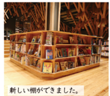
新しい棚ができました。

階段を少し上げれば、踊り場のようなスペースにある井戸端エリア。フラット寄って気軽にお喋りが楽しめるフリースペースです。本棚は絵本からステップアップした小学生向けの本が並ぶ背のびコーナー。日本・外国の物語や生き物、日本の文化、科学など子どもの興味が湧いてくるようなワクワクする本が並びます。大人でも楽しめる本も盛りだくさん！お喋りしながら、読書をしながら、家族や友達と気ままに過ごしてみたいかがてしょう。