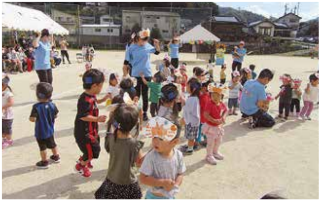
【乳児組】踊り「ベビちゃんに」

10月3日(土)は、第10回栲原こども園の運動会が開催されました。 今年度は、新型コロナウイルス感染症予防策として時間短縮のため、競技種目を減らし、会場を栲原学園グラウンドに変更し、保護者のみの参加としました。 乳児組さんはお家の人と離れがたく涙を流す子ども