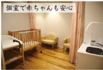
個室で赤ちゃんも安心

1階から半分下りたところにあるえほんコーナー。子どもたちの興味や発達に応じた絵本が並び、木のぬくもりを肌で感じながら絵本を読むことができます。また、椿原町地域子育て支援センター（愛称：カンガルーのおなか）として土・月は午前中、日は午後保育士が常駐。ちょっとした子育ての悩み事も気軽に相談できます。ベビールームも完備しているので、赤ちゃんと一緒にでも安心。親子でお気に入りの絵本を探してみませんか？