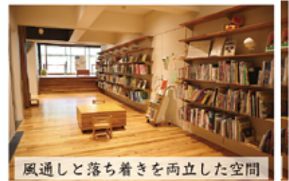
風通しと落ち着きを両立した空間