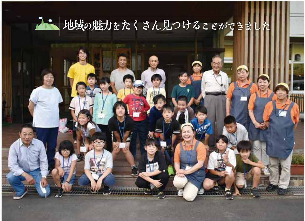
お世話になった越知面の皆さんと