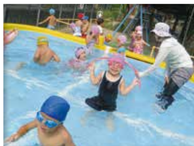
元気にザブーン (きりん組・4歳児)