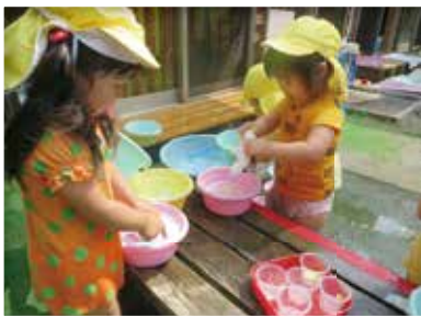
お洗濯ごっこしたよ (うさぎ組・2歳児)