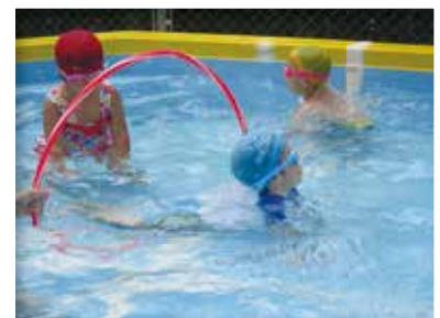
ワニ泳ぎができたよ (ぱんだ組・3歳児)