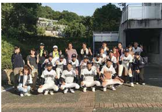
県中学校選手権大会

秋季大会の開催が決まっています。今まで耐えてきた分をこの大会で発揮してほしいと思います。 県中学校野球選手権大会 8月11日(火)、第71回高知県中学校野球選手権大会が開幕しました。今年は例年実施している開会式は行われませんでした。 梶原中学校は大会2日目の8月12日(水)に土佐山田スタジアムで試合がありました。 1回戦の対戦相手は、土佐町中学校でした。 2対1でリードしていましたが、6回裏に逆転され、2対3で負けてしまいました。