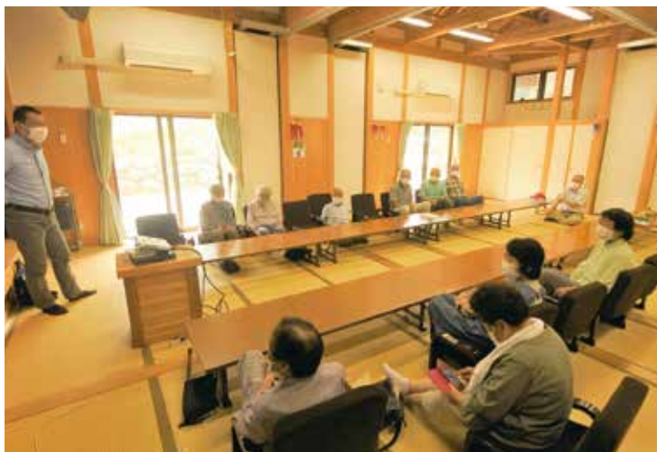
えこ・まち研究室さんとの意見交換会の様子／鷹取の家会場（初瀬区）