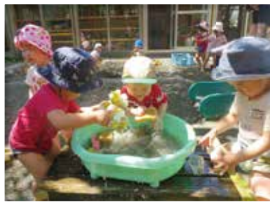
思いきり水をバシバシや! (りす組・1歳児)