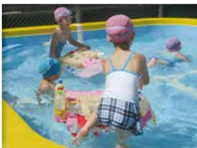
いかだを作ったよ (ぞう組・5歳児)