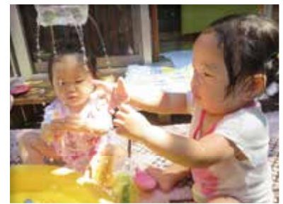
触ってみようかな (ひよこ組・満1歳児)