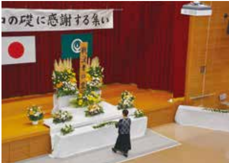
遺族の方の献花の様子