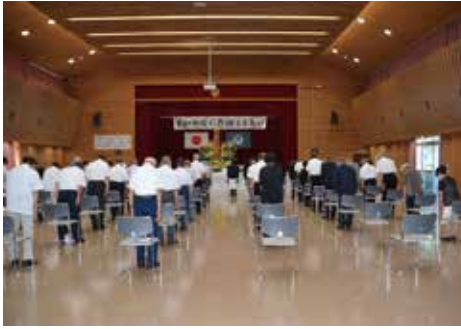
平和の礎に感謝する集いの様子

式典には、町議会議長、区長会長を来賓に迎え、遺族の方々約50名に参列いただきました。平和の礎となられた戦没者の御霊に対し、ご冥福と恒久平和への祈りをささげ、戦後75年の節目を迎え、戦争の記憶を風化させないと改めて誓