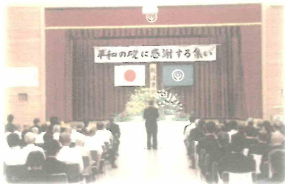
平和の礎に感謝する集いの様子です