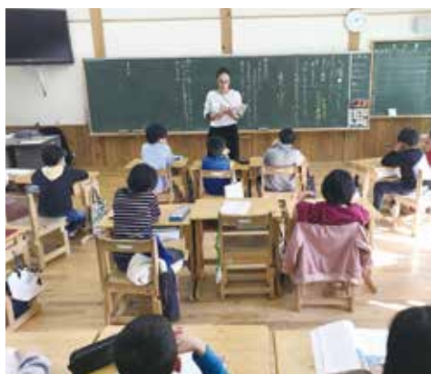
「分け隔てしないで」の授業 3年生

授業は、全クラス人権の授業を公開し参観していただきました。人権は、人が生まれながらに持っている権利のことです。子どもたちにも人権の意義・内容や重要性について理解させ、「自分の大切さとともに他の人の大切さを認めること」ができる人権意識を養うた