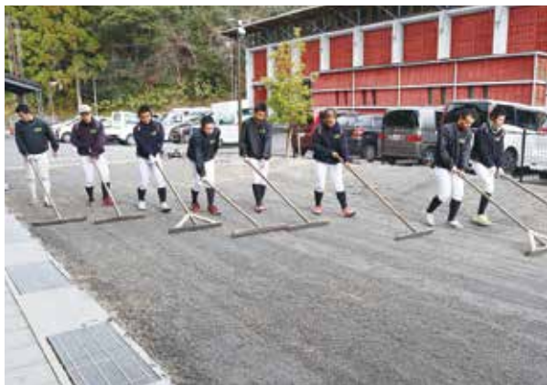
作業中の野球部の皆さん

12月15日(日)、ボードゲーム体験会を行いました。今回もいろいろなゲームを体験し、楽しい時間を過ごすことができました。12月21日(土)、歌とお話のクリスマス会を開催しました。読み聞かせボランティア絵本の小部屋さんによる歌や絵本の読み聞かせを行い、館内がクリスマススムードに包まれました。また、松ぼっくりのミニクリスマスツリー作りのワークショップにも、たくさんの方に参加いただき、それぞれかわいらしいツリーを完成させていました。