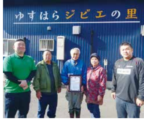
認証を受けた施設と皆さん

昨年12月、「ゆすはらジビエの里」(広野)が厳格な衛生管理などの基準をクリアした施設として県内初、国内では9施設目となる農林水産省の「国産ジビエ認証」を取得しました。