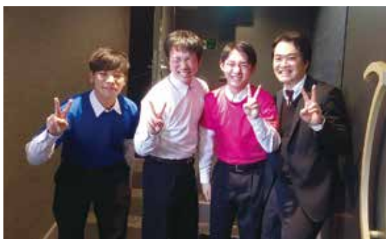
発表直前の舞台裏

発行所／高知県高知郡梶原町役場 ☎0889-65-1111 URL http://www.town.yusuhara.kochi.jp/ 発行 兼 編集／梶原町役場 印刷所／荷中島出版印刷