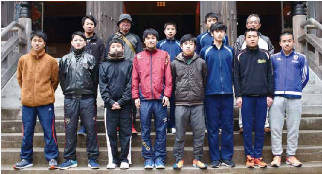
今回参加した皆さん