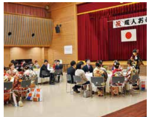
二十歳のメッセージの様子