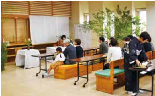
雲間気満点のお茶席の様子

ラマ作品を作り上げていました。また、1階ロビーでは、文化協会の石州流梶原教室の皆さんによるお茶席が開催されました。参加した方々は、おいしいお茶とお菓子を味わいながら、ゆったりとしたひとときを過ごされていました。