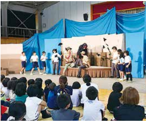
劇団「風の子九州」劇公演

劇の公演がありました。この日の演目は、「このゆびとまれ!」でした。普段見慣れている体育館が舞台に変わり、体育館に入った瞬間にワクワクしました。1時間15分の劇があっという間に終わり、笑いあり、シリアスな場面ありの大変見応えのある公演でした。この劇には、4年生も出演し、素晴らしい演技をして、公演を盛り上げました。