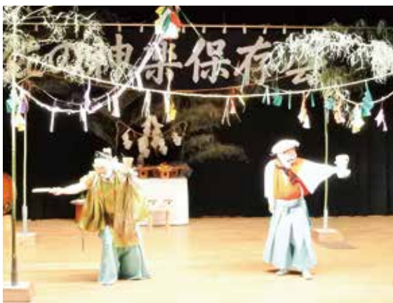
津野山神楽～演目「豊饒舞」の一部