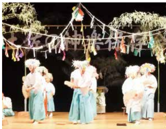
いざなぎ流神楽～演目「錫杖・扇の舞」の一部