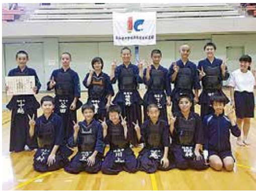
剣道部男子団体戦 3位

9月29日(日)、第62回高知県中学校秋季剣道大会が春野総合運動公園体育館で行われました。男子団体では、1回戦香我美中学校と対戦し、4対1で勝ち、2回戦学芸中学校とは、勝利数1対1、取得本数1対1で引き分けでした。代表決定戦の末、勝利することができました。準々決勝では、朝倉中学校に3対2で勝利しました。準決勝は、優勝した高知中学校との対戦でした。勝利数1対1、取得