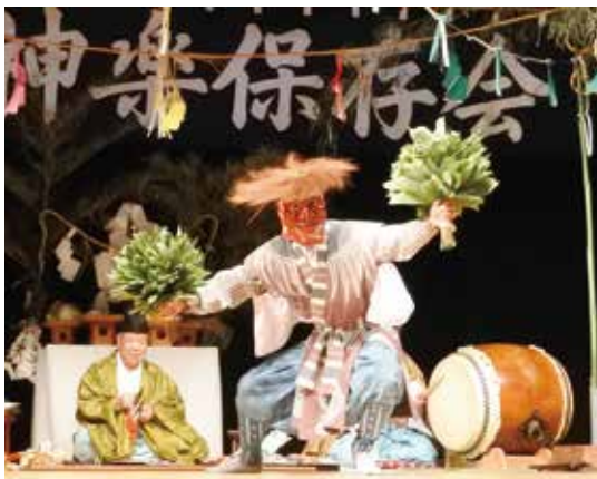
池川神楽～演目「四天の舞」の一部