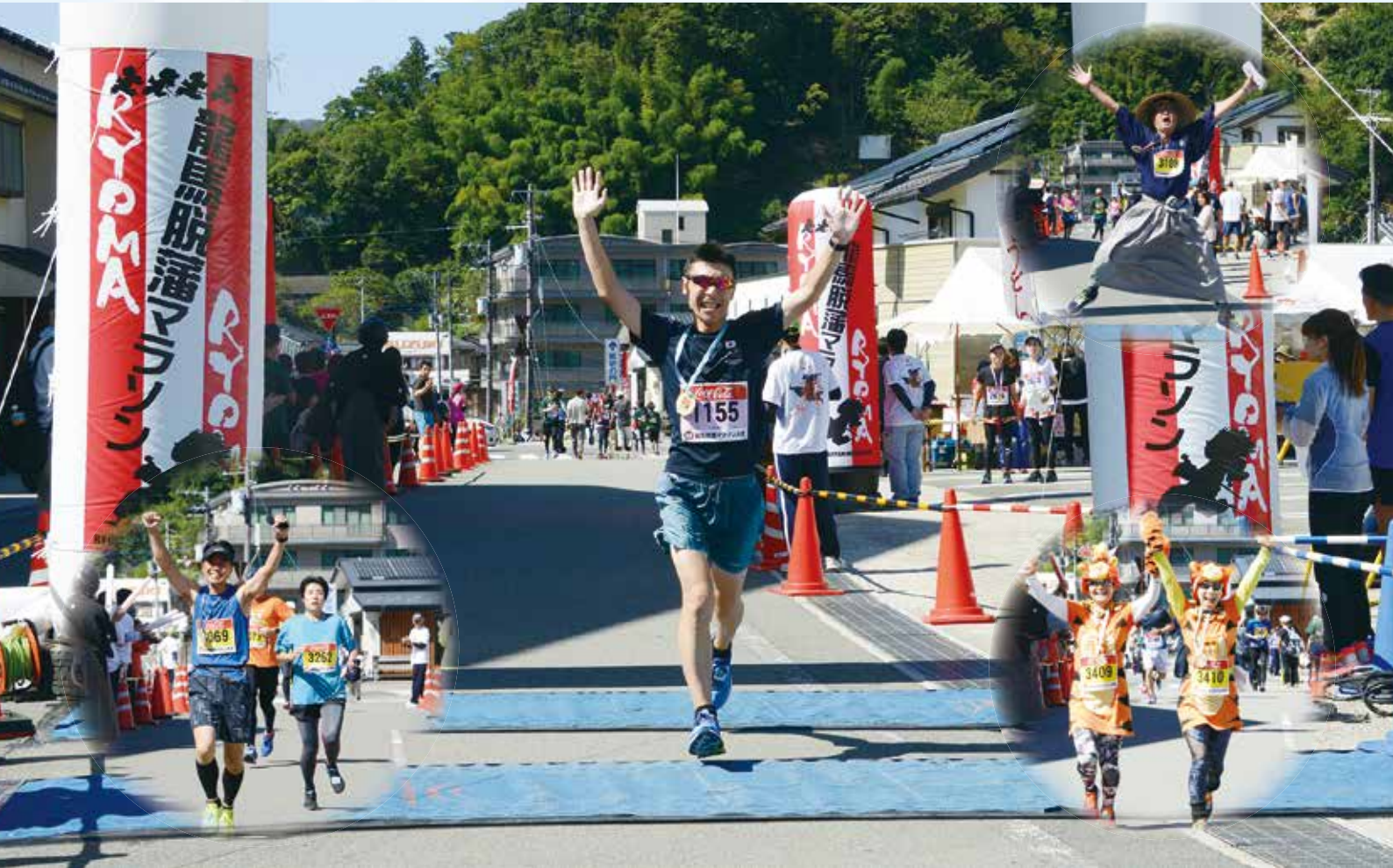
龍馬脱藩マラソン大会