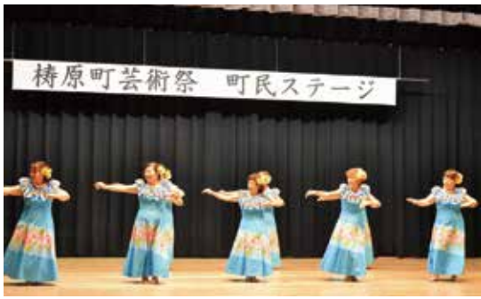
フラダンスサークル

ゆすはら・夢・未来館では、1階会議室で昨年に引き続き海洋堂ホビー館四十万によるジオラマ体験教室を行いました。参加した子どもたちは、試行錯誤しながらも楽しそうに世界で一つだけのジオ