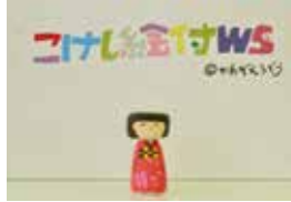
思い思いの素敵な作品が完成 かわいいこけしが完成しました!