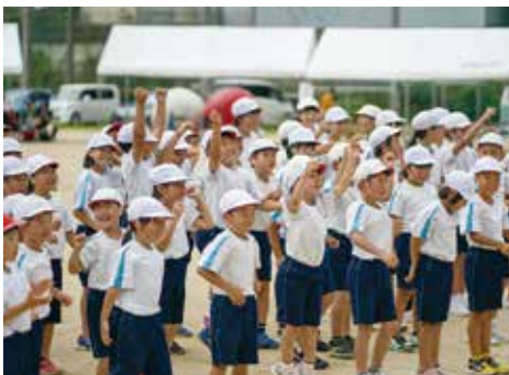
喜びに沸く白組小学生

練習に一生懸命取り組み、当日も持てる力を精一杯発揮しました。28種目に及ぶ激闘の末、見事優勝したのは白組でした。赤組の3連覇を阻みました。