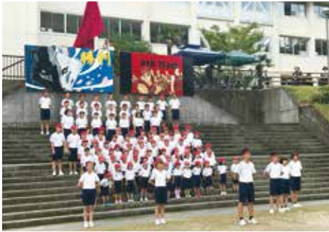
紅白のパネルの前に立つ赤組応援団