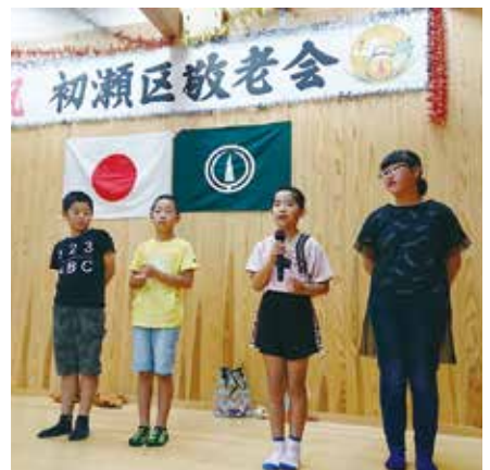
初瀬地区で発表する子どもたち

この達成感を次のエネルギーに替えて、また頑張らせていきたいと思えます。毎年、この運動会を楽しみに参観してくださる来賓並びに、地域の皆様ありがとうございます。