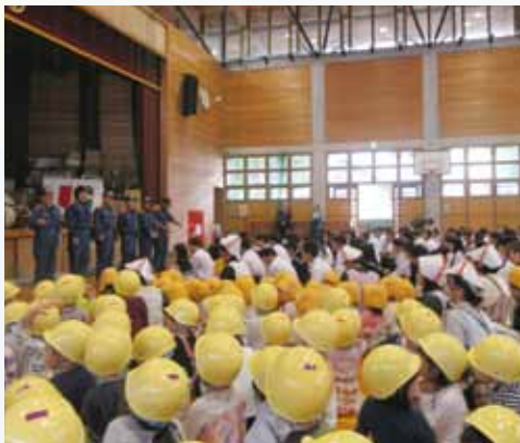
消防さんからのお話

サイレンの音やいつもと違う雰囲気になったり、泣いたりする子もいましたが、高校生に抱っこしてもらい全員が安全に避難することができました。消防署の方から火災について、出火した際には①火災受信