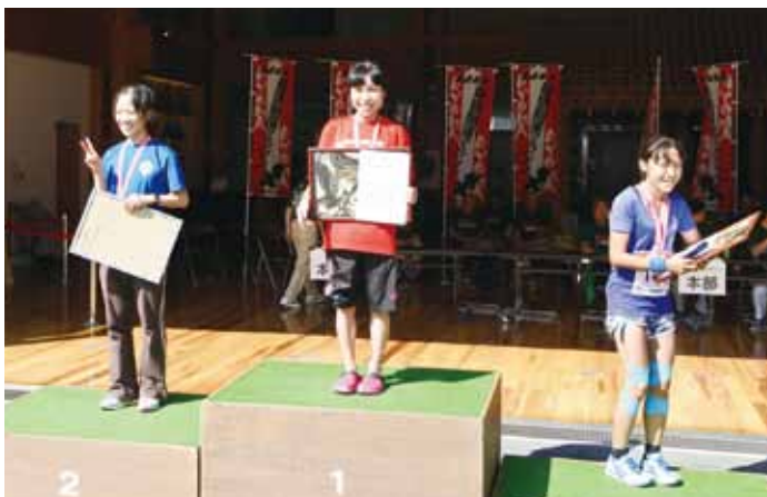
フルマラソン女子の部 表彰式