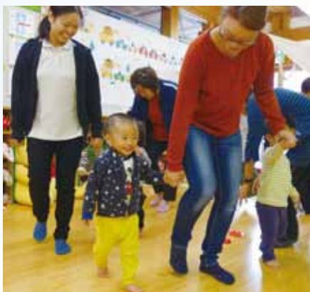
おかあさんといっしょってうれしいな

絵本を読むときは表紙から裏表紙まで丁寧に読むこと(題名・作者を読み、中表紙まで見せる)。また絵本を読んであげる