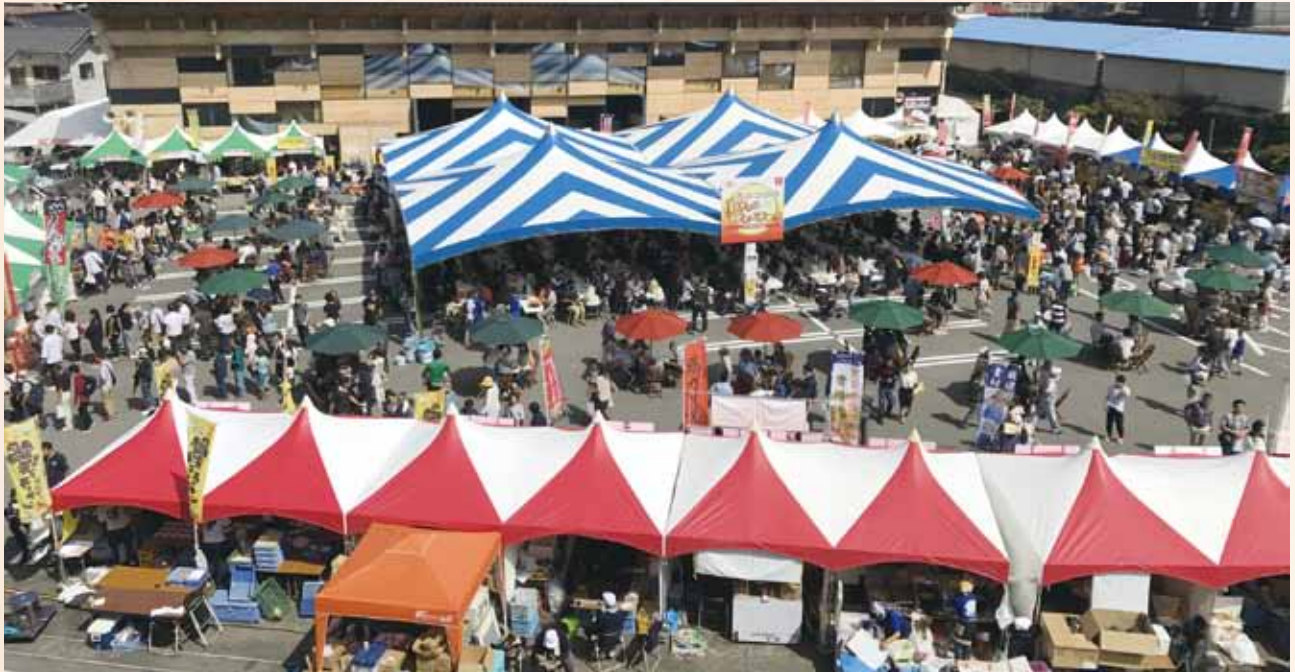
大勢のお客さんでにぎわうグルメまつり会場

9月23日(土) 24日(日)にゆすはらグルメまつり及び土佐牛まるかじり大会が開催しました。