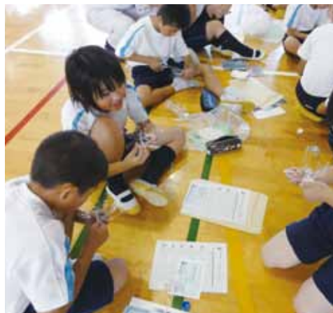
一生懸命風力発電用風車を作成中

風力発電のしくみ、国内でどれだけ発電しているのか等、話を聞いた後、実際にペットボトルで風車を作り、扇風機でそれを回して発電しました。よく回るようにするには、羽の大きさ、バランス、