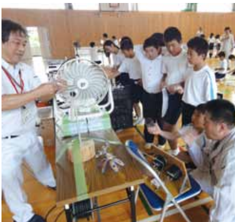
電気を作ることができるかな！

角度等、自分で調整しながら作製しなければなりません。楽しみながら風力発電について学べた時間でした。