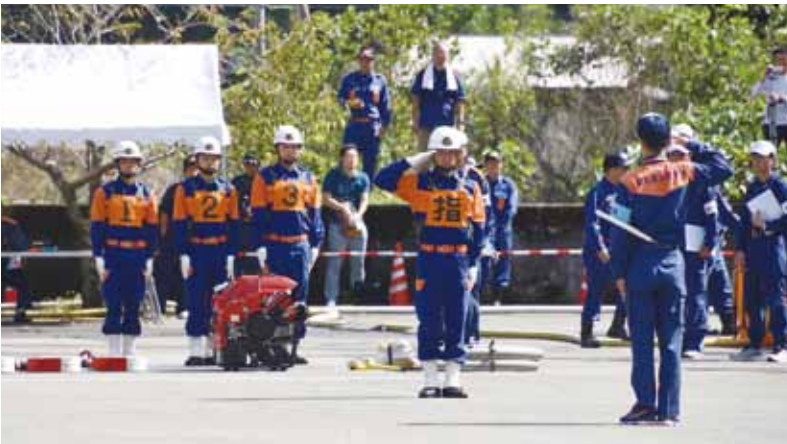
第3分団の操法の様子