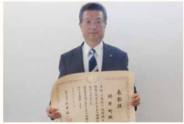
第29回住生活月間功労者表彰 個別表彰式の様子