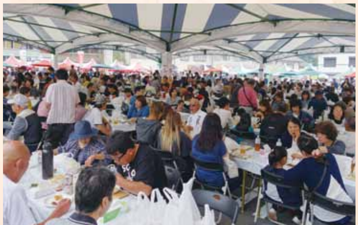
グルメまつり会場内飲食スペース

今年は駐車場のシャトルバス乗り場で多少の混雑等がみられたものの、2日間で両会場合わせて約30,000人もの方々にご来場いただきました。事故等もなく好評のうちに終了することができましたのも、町内各種団体、事業者