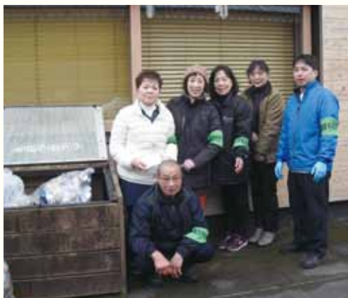
ごみの見回りもしています

私たち大人も、子どもたちの手本となるよう、今一度ごみの出し方に気を付けましょう。