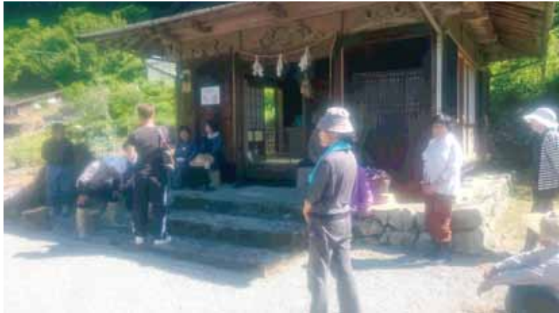
地域で決めた集集場所で安否確認

これからの季節、大雨等による避難準備情報等の発表が予想されます。避難するときは、隣近所に声掛けをして近所の人の安否確認を行い、協力して避難しましょう。