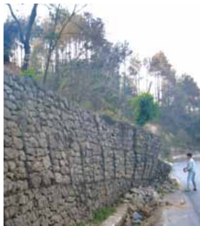
ネパール 蛇籠崩壊箇所

今後は、事業のプロジェクトマネージャーである高知大学原教授とともに町職員・土木技術者と現地技術者との相互訪問により、改良型蛇籠の設置、実地指導を行い、ネパールに適した防災蛇籠の設計・施工ガイドラインの作成を目指していきます。