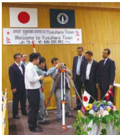
測量機材の使用方法について説明

23日には、役場で歓迎式を行い、町からこの事業推進のために測量機材を贈呈し、使用方法について説明しました。