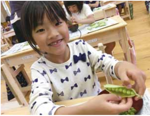
いっぱい入ってます！

直接食材に触れたり、誰かの協力があって食べられるものであることを子どもたち自身で学び、嫌いなものも頑張って食べようという気持ちが養われた体験となりました。