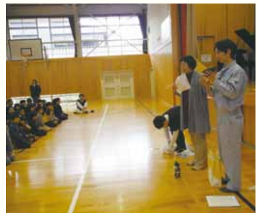
梶原学園でごみの分別について講話

ごみを食べ物、クリーンセンター四十万を口に例え、「食べ物に硬いものが入っていたら、お口の中を怪我しますよね。危ないものは入れてはいけません。」と話す、生徒の皆さんも領きながら真剣に聞いてくれました。