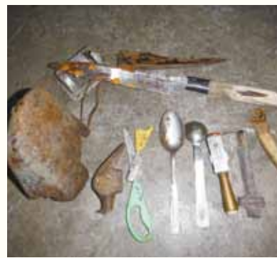
混入していた金属類

そのため、金属類のような硬いものが混ざっていると、すりつぶす過程で機械にひっかかり、最悪の場合機械が壊れてしまいます。ライターが入っていると、爆発することがあります。機械が壊れると、ごみの処理ができなくなり、修理にもたくさん