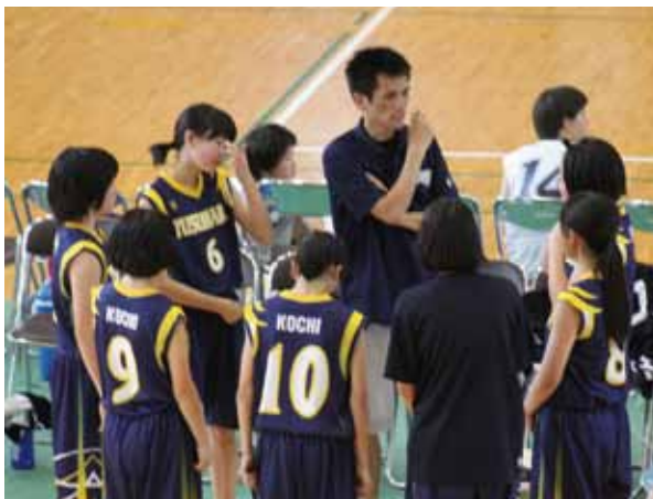
女子バスケ部作戦会議

6月10日(土)～12日(月)の三日間、第71回高吾地区総合体育大会が行われました。本校は男女バスケットボール、軟式野球、女子バレーボール、男女剣道の4種目に参加しました。みんな全力で大会に挑みました。前半勝つていて、逆転されても再逆転したり、自分たちより実力が上の相手にもひるむことなく、あわや勝利するのではというところまでいった