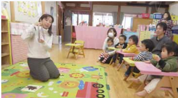
目を丸くして絵本を見ている

には各クラスごとに絵本を読んでももらいました。子どもたちも受け答えしながら楽しんでそこに聞いてました。幼児組は、ホールに集まり絵本を読んでもらいながら、保護者の方にも、絵本を読み聞かせする時のポイントなどを教えていただきました。保護者の方にも「くだもの」と「おおきなかぶ」を読んでも