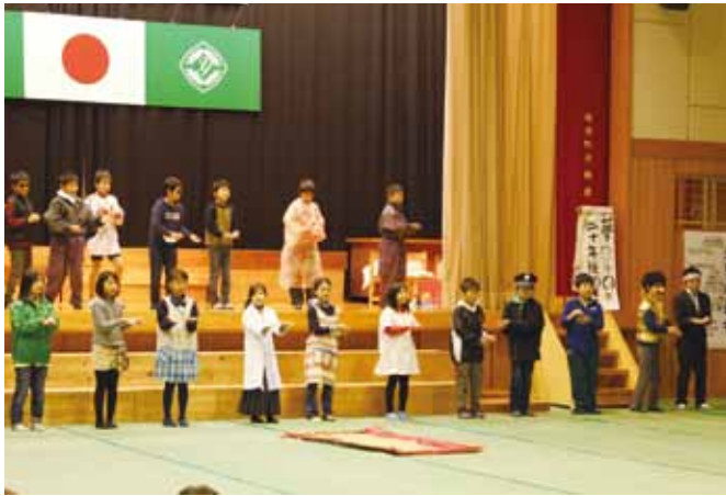
4年生の「夢20年後の未来」

どの学年も4月からこの日を意識しながら学習に向かってきました。今年度もそれぞれの学年で学