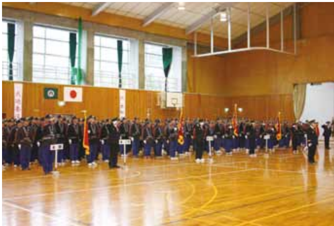
平成29年出初式の様子

式典終了後は、各分団機械器具、消火栓、防火水槽、消防道等の点検、高齢者の住宅を訪問し、災害への備えや火気取扱場所等の安全確認を行い点検終了後に初午行事や、火鎮祭の神事で一年間の無事故無火災を祈願しました。