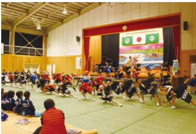
5・6年生による「Newソーラン節」

級の持ち味を出しながらの発表会になりました。昨年度に引き続き、劇団「わらび座」の役者さんに来校していただき「Newソーラン節」の振りつけを5・6年生に指導していただきました。その成果を堂々と発表することができました。