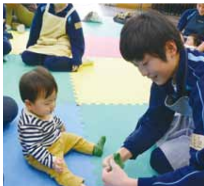
ふれあい体験の様子