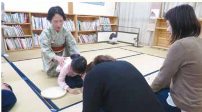
上手にできました

らいました。また「まるまるまるの本」は、絵を楽しむ本で先生の合図で手をたたくと丸が増えたり減ったり、大きくなったりして、絵本に引き込まれていました。絵本は子どもたちの心を豊かにしてくれと改めて感じました。参観日を通して、「家では見られない姿が見れて良かった。」「自分でできることが増えて