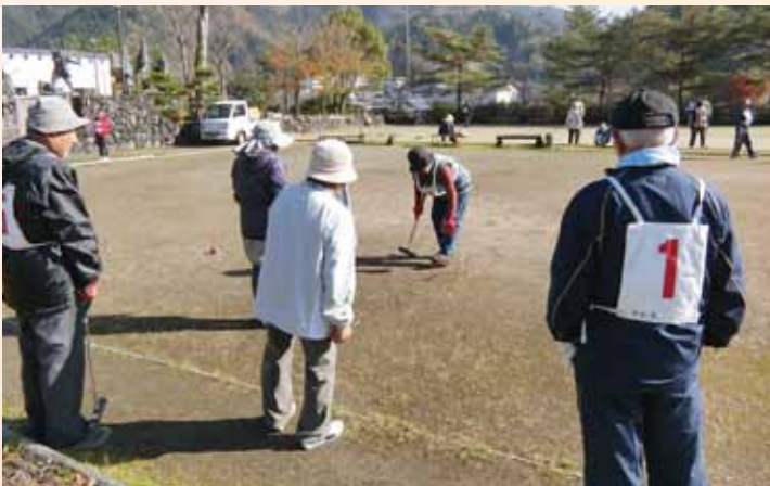
会長杯ゲートボール大会