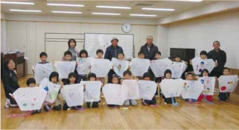
学園児童と土佐凧づくり

先生の型紙に合わせて、はさみ入れから糊づけを準備し、続いて竹ひごに合わせて糊付けした糸を結び付け、尾びれを凧に合わせ調整し、バランスよく仕上げました。屋外では風が強く吹いているので、少し心配しました。