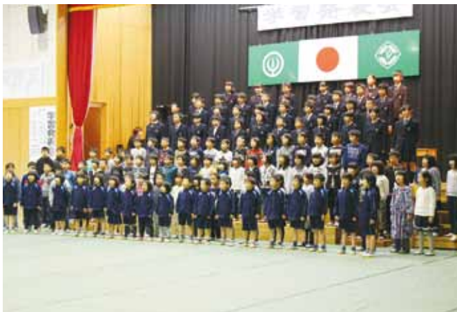
全員による「ゆすはら」の合唱

できていました。5年生も普段から元気な子どもたちが、さらに元気に発表できていました。 最後の1年生から6年生までの全体合唱では「ゆすはら」を歌い、素敵な歌声を会場に響き渡らせ、ご来場の皆さんに感動していただきました。 来賓をはじめ保護者や地域の多くの方々に参観していただき昨年度同様、賑やかに終えることができました、子どもたちにとって達成感のある学習発表会になりました。 ご来場いただきました皆様、ありがとうございます。