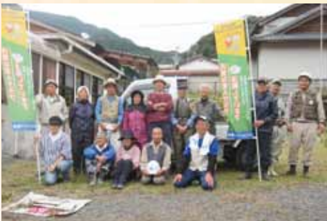
役場周辺の除草作業