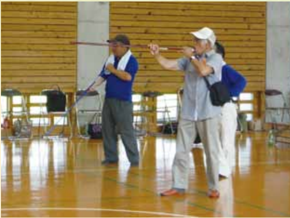
若手高齢者スポーツ交流会

越知面区集活センターを利用して、4町152名が集い、スポーツと創作活動に分かれ親睦を深めました。地元の方々の手作りのお菓子、コーヒー等を買って来て舌鼓!! 全員集合の和やかな交流会となりました。