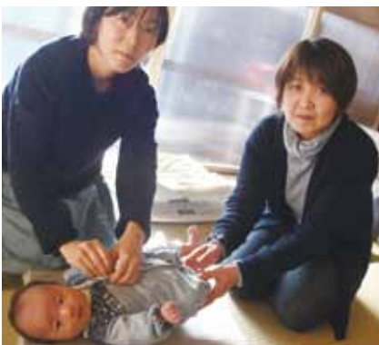
助産師による訪問