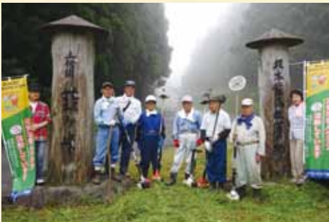
葎ヶ峠の除草作業

葎ヶ峠にて公園付近の草刈り作業とトイレ建物の清掃。地元の方々の努力か、塵や缶類、ビニール製品等も少なく、自然が美しく輝いていました。