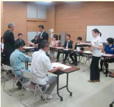
新しい委員の皆さんへ委嘱状の交付

この度、立ち上げ当初から活動いただいた町民会議委員の皆さんが任期満了となり、新体制で活動を行っていく事になりました。