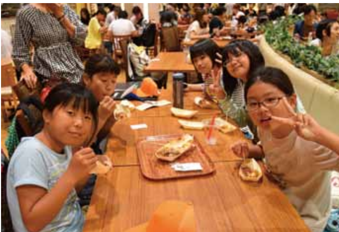
みやっ子の子供たちと一緒に

今回は2泊の民泊で、民泊先の思いのこもった対応で榑原では、味わうことができない遊びや見学を十分に楽しむことができました。