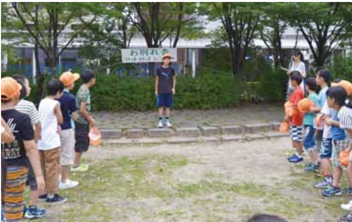
西宮市役所の広場にて

今回の交流事業は、みやっ子との交流をとおして都会の良さ栲原の良さ、友だちの大切さを知ることができたと思います。