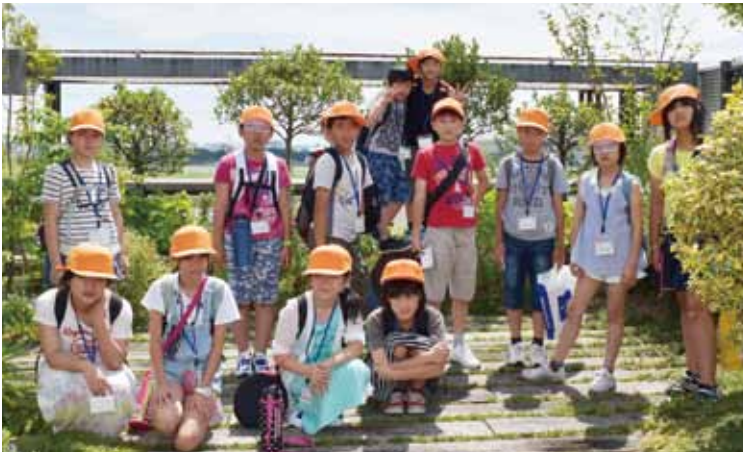
ゆすっ子・みやっ子 in にしのみや 2016 (伊丹空港にて)