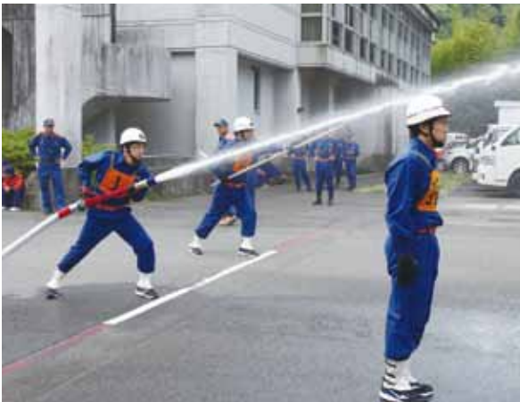
小型ポンプ操法 (第4分団)