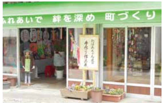
写真：西村美子宅の作品展（中町）