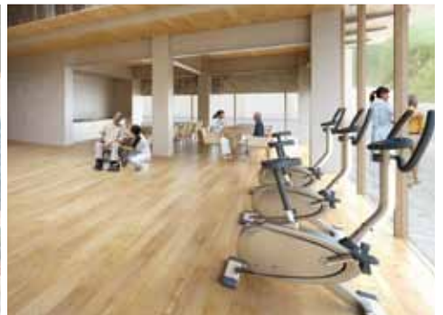
写真：「ゆすはら複合福祉施設」内部イメージ