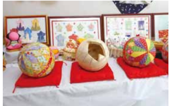
写真：木目込み鞠と鞠の芯