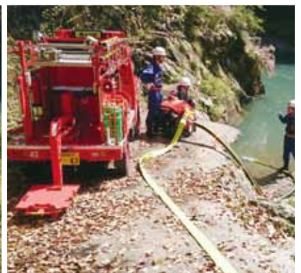
写真：消防道から連鎖