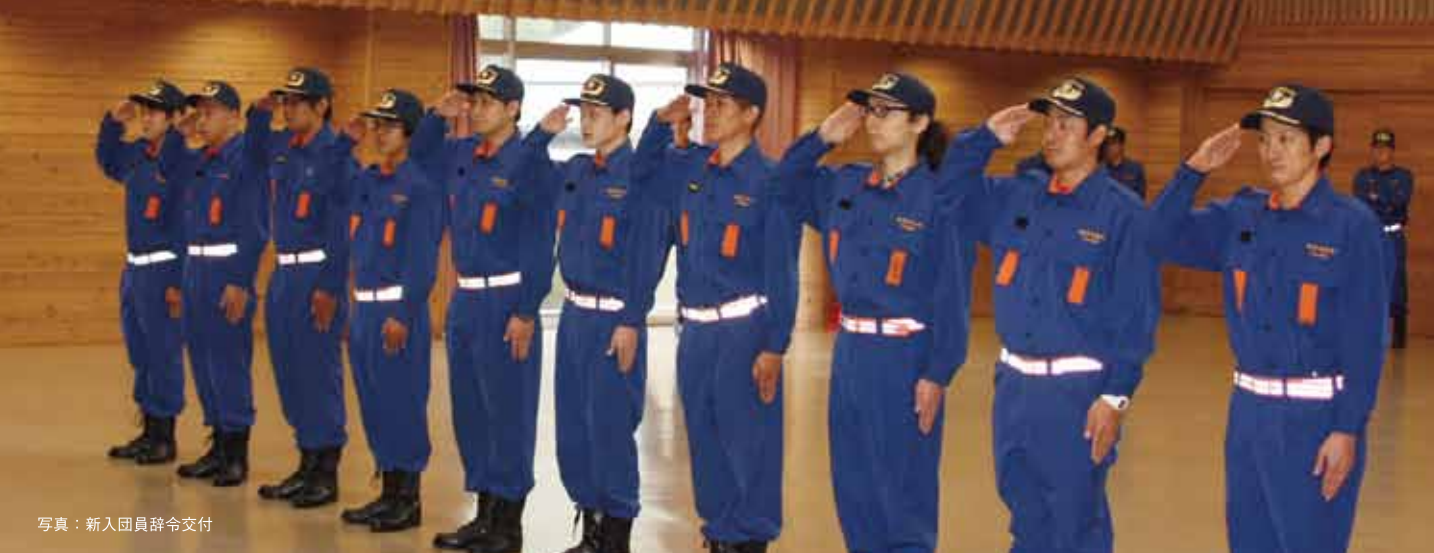
写真：新入団員辞令交付