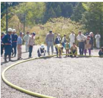
写真：ホースの圧を確認