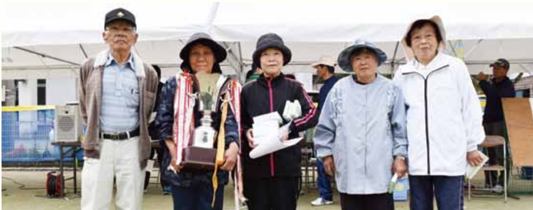
写真：優勝された四万川チームの皆さん