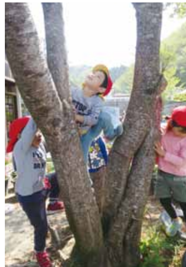
写真：幼児組、外遊びの様子

地域の皆様には、今年も散歩だけでなく、地域行事などにも参加するなかで、皆様との交流を深めていきたいと思っておりますので、今年度もどうぞよろしくお願いたします。