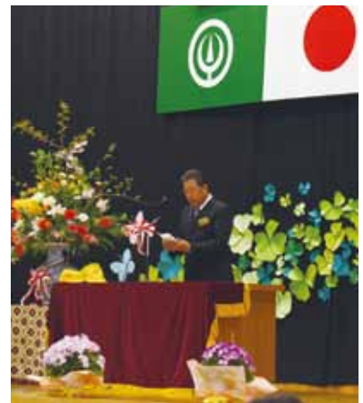
写真：校長先生の式辞

入学式では、小中一貫教育校らしく、7年生が1年生の手を引いて入場しました。今年度の新1年