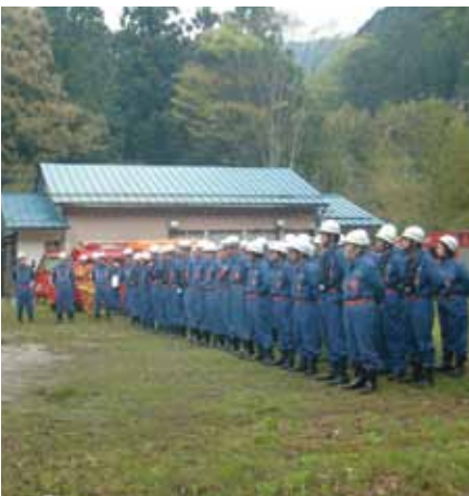
写真：両消防団集合

南海トラフを震源とする大災害発生時等の際に、連携と協力体制が確保できるように災害活動等に備えて参ります。