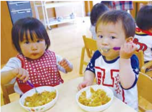
写真：乳児組、給食の様子

乳幼児期は、生涯にわたる「生きる力」の基礎が養われる大変重要な時期です。園では、養護の行き届いた環境のもと、生命の保持や情緒の安定を図り、「環境」「人間関係」「健康」「言語」「表現」等の各領域にわたり、心情・意欲・態度の育成を目指し、それぞれの年齢や子どもの実態に応じた教育・保育課程を編成し、子どもたちにとって「遊び・学ぶ楽しさ」が実感できるように、また、子どもたちが安全で、安心して生活のできる「梶原こども園」づくりを職員一同で取り組みます。