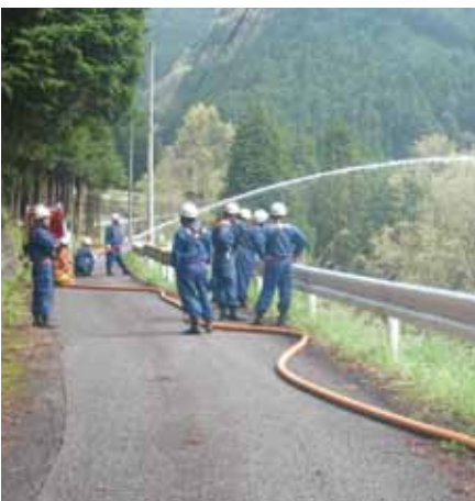
写真：第2火点から放水

南海トラフを震源とする大災害発生時等の際に、連携と協力体制が確保できるように災害活動等に備えて参ります。