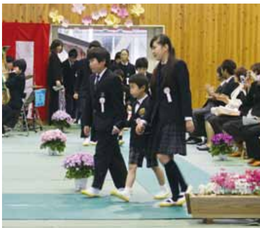
写真：7年生のお兄さんお姉さんと一緒に入場

4月7日(木)、梶原学園体育館で、28年度の教職員着任式、始業式に引き続き、入学式が行われました。昨年の11月に新入生の1年生と7年生が一緒に植えたチューリップのつぼみも膨らみ入学式を喜んでいました。1年生は真新しいランドセルを背に保護者の方に手を引かれ待ちに待った梶原学園の門をくぐったことでしょう。7年生は制服に身を包みまた、新たな気持ちで登校したことでしよう。