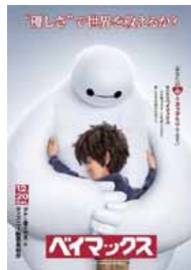
「ベイマックス」は、出生がハーフの少年を主人公に据えた、初のディズニー映画です。 © 2015 Disney

他方、日本の場合、外国人を細かく分類する（アメリカ人とか、スリランカ人といった風に）ことは普通ありませんが、「日本人と外国人」の区別は、それでも厳然として存在しています。日本で人生の大半を過ごしてきた、人種的にはハーフではあるけれど国籍は日本の友だちが僕には何人もいますが、彼らは多くの