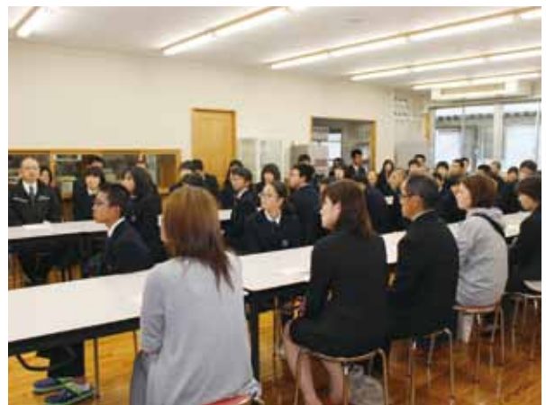
写真：梶の木寮の食堂で入寮式を行いました

転入生も含め新しく11名が入寮することになりました。8・9年の在寮生をあわせると計38名となり、中学生の半数の生徒が寮で生