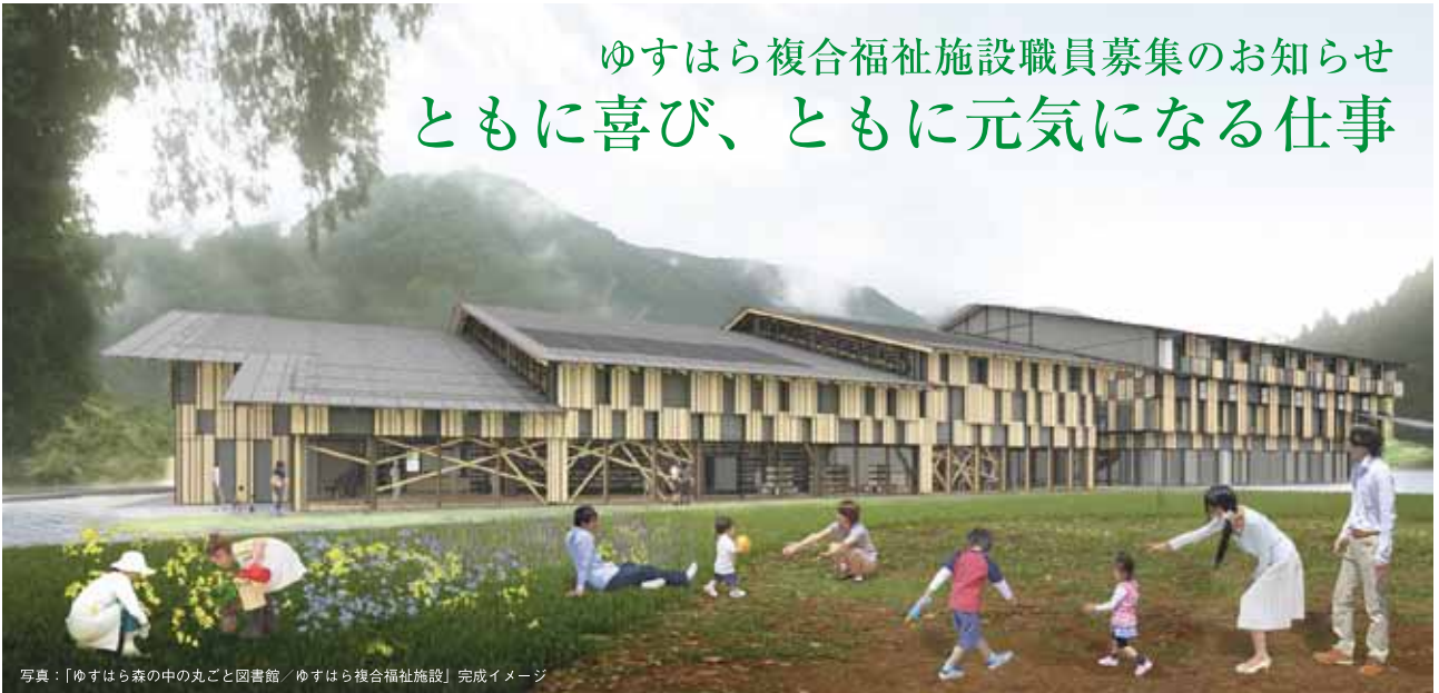
写真：「ゆすはら森の中の丸ごと図書館／ゆすはら複合福祉施設」完成イメージ

梶原町社会福祉協議会に、施設設立準備室が設置され、「ゆすはら複合福祉施設」が、平成30年3月オープンに向けて準備を進めています。