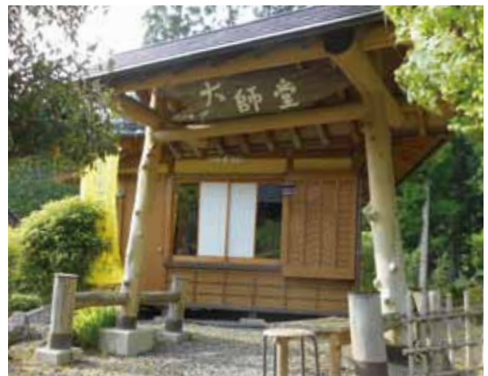
写真：切り絵展の大師堂（太郎川）

宮城県東松原市に、東日本大震災の早期復興を願って3百点、そのほか町内外の福祉施設や公共施設にも多くの作品を寄贈したと話されていました。