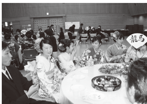
楽しく歓談中の新成人の皆さん

大学で福祉の勉強をしています。友達の支えがありました。感謝しています。将来は、問題を抱えた児童のためになにかしあげたいと思っています。いろいろな出会いを大切にしていきたいです。