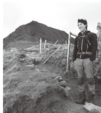
大学時代、ウェールズにあるSnowdon (1,085m) という山に登った時の写真です。

雪と言えば、久万高原にスキーをしに行きましたが、これが人生で初めての体験でした。すごく楽しかったですが、それは新しいスポーツに挑戦できたからですし、小学1年生が慣れない一輪車で転ぶみたいに、何度となく転んでしまったからでもあります(まあ、転び方は僕の方がうまいとは思いますが)。自分が住んでいる場所から、こんなに近くでスキーが楽しめるのは、かなりラッキーだと思います!あとは、イオンモールが、同じくらい近くにあったということないんですけど……。イギリスでの大学在学中、友だちとあちこちの冬山登山に行くのに、だいたい、車で6時間ほどかかっていました。一度、スキー場の近くで山登りをしたことがありましたが、その時はスキーやスノーボードのスピードぶりを横目でうらやましそうに見ながら、雪の中をトロトロと歩いたものです。