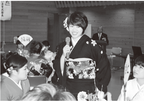
これからの決意を述べていただきました