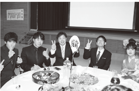
盛り上がりはこれからです

将来の夢である看護師を叶えるために2月に国家試験があります。社会人として責任を持った行動をしたいです。