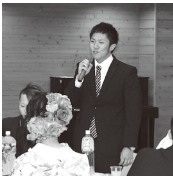
一人ひとりメッセージをいただきました

岡山で専門学校に通っています。今は獣医師になる勉強をしています。2年制から3年制へと変更になり両親には迷惑をかけています。学会等にも発表しています。頑張つて勉強していきたいです。