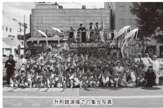
升形競演場での集合写真

梶原を通して、年齢や性別、地域を超えて交流し、一つのことに取り組む。こうした体験こそ、梶原の魅力を改めて感じることができると感じています。