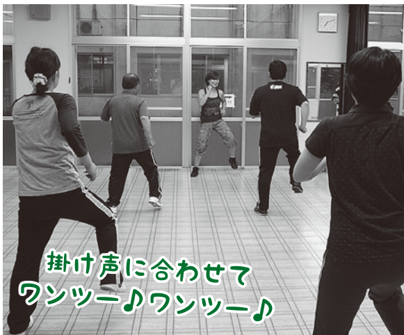
掛け声に合わせて ワンツー♪ワンツー♪