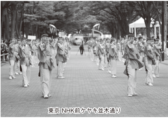
東京 NHK前ケヤキ並木通り