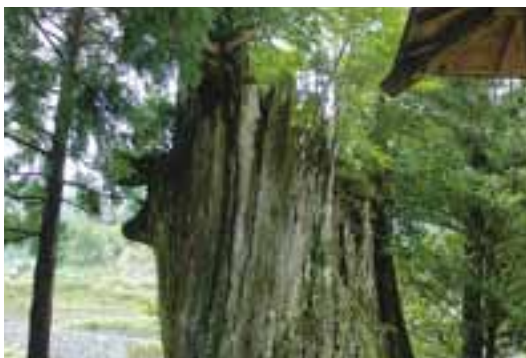
25 神在居の折れ大杉