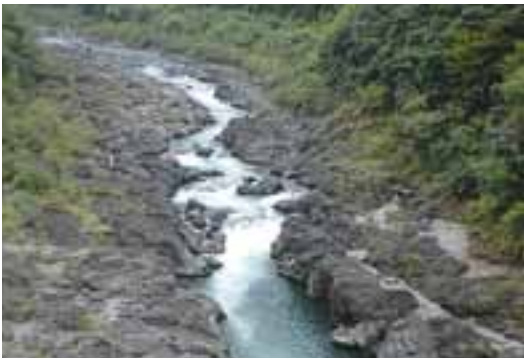
2 急流八百とどろ（松原）