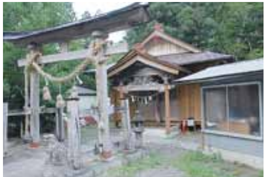
54 大鳴見神社（下折渡）