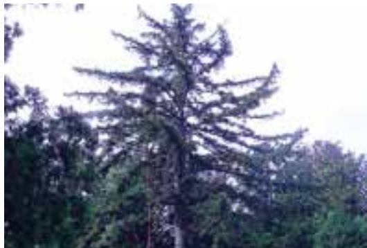
24 栲原三島神社のハリモミ