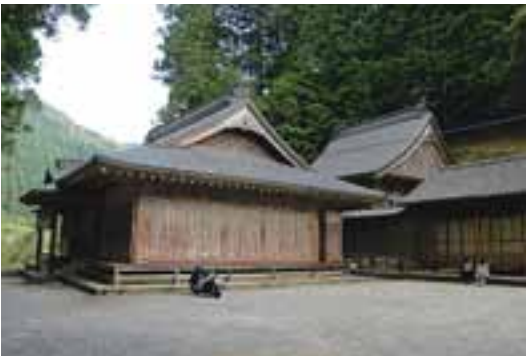
49 西区三嶋神社（竹の藪）