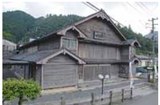
45 ゆすはら座（芝居小屋／東町）