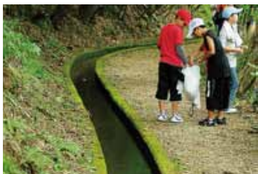
2 松原の水路（久保谷川の森林セラピーロード）