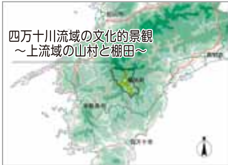
四万十川流域の文化的景観 ～上流域の山村と棚田～

栲原町は、高知県の北西部、四万十川上流域にあり、日本3大カルストの一つ、四国カルストの五段城（標高1456m）に源を発する四万十川最大の支流、栲原川の源流域に当たります。