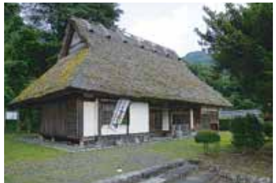
44 旧掛橋和泉邸（東町）