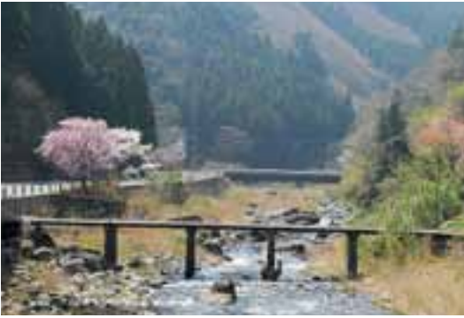
1 栲原川上流部（後別当）