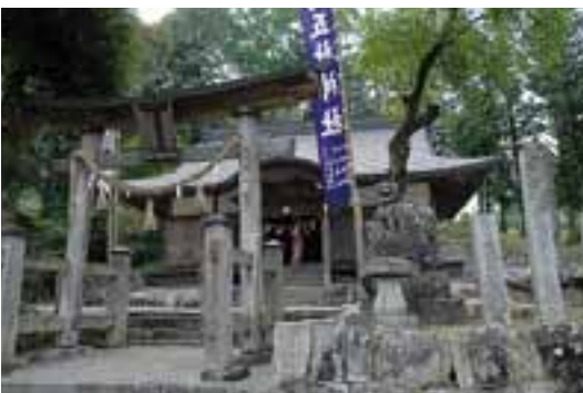
51 三嶋五社神社（田野々）