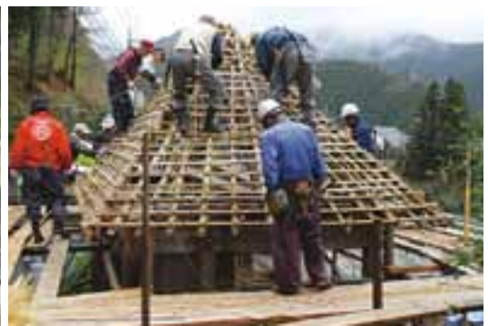
4 かやぶき屋根の葺き替え（川西路茶堂）