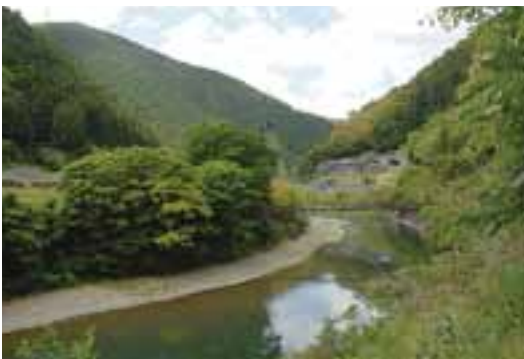
5 栲原川と初瀬集落