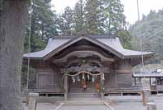
47 栲原三嶋神社（川西路）