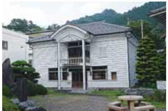
46 旧栲原町役場庁舎（総合庁舎前）