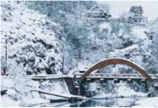
1 栲原川の冬（町中心部）