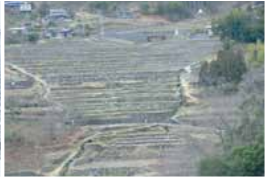
7 神在居の棚田集落