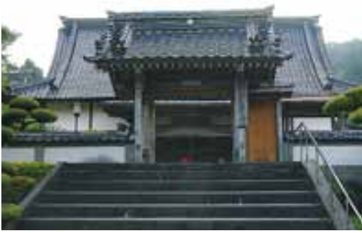
48 天徳山吉祥寺（川西路）