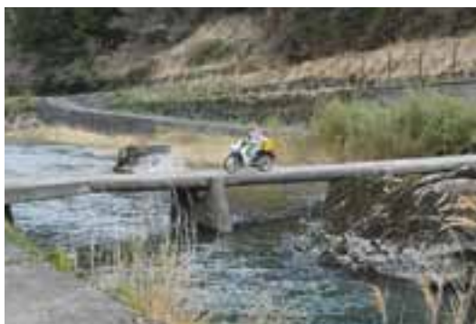
35 新道橋（沈下橋／川口）