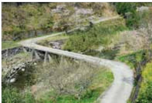
33 石藪沈下橋（後別当）