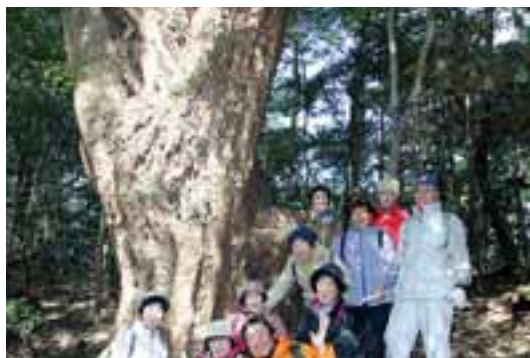
12 久保谷山の巨大な赤檜